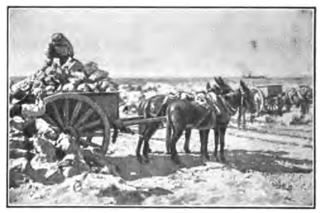
Una Mina de Nitrato

país es el guano y el salitre que también se encuentran en esta región.